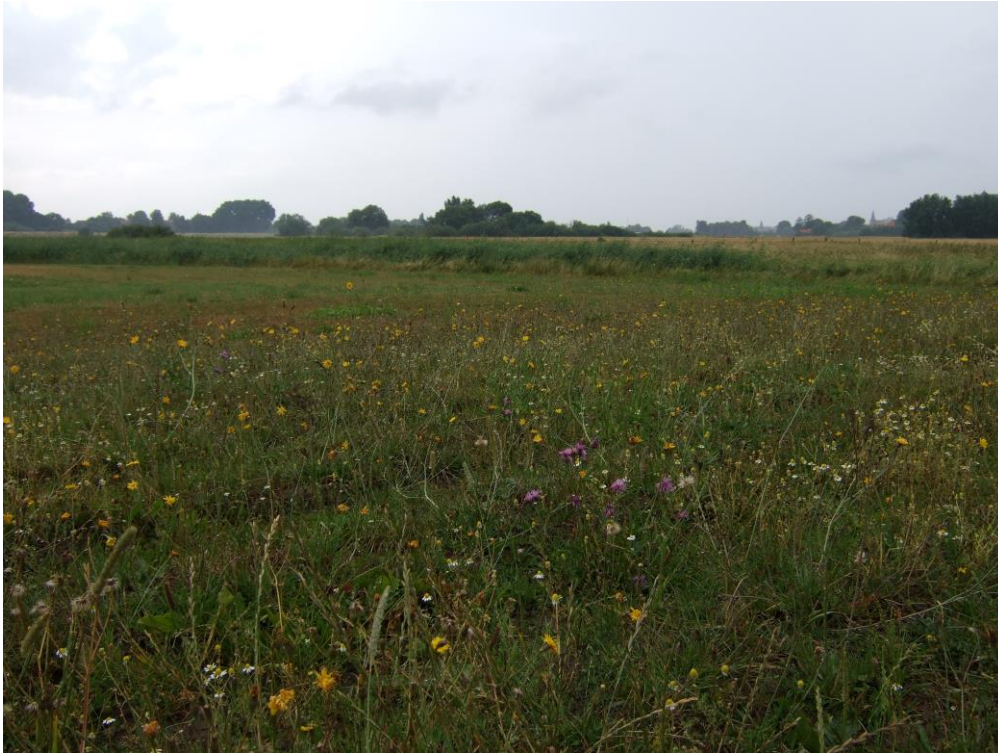
結果に基づく農業環境支払いの対象となっているニーダーザクセン州の草地