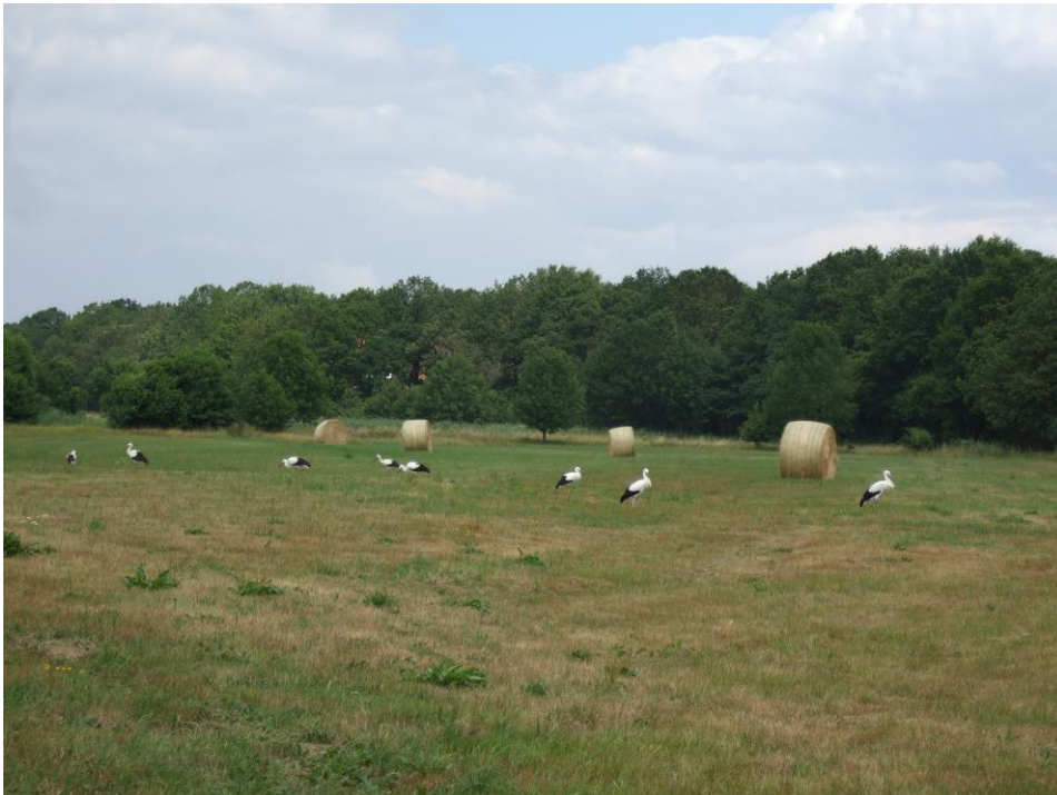
ドイツの北部のコウノトリ保全のための農地管理事業の実施地区

これに対して「結果に基づく農業環境支払い」は、生物多様性保全の効果そのものが支払いの条件になる助成方法である。「結果に基づく農業環境支払い」とは実際にはどのようなものか。ヨーロッパでの取組を紹介する。