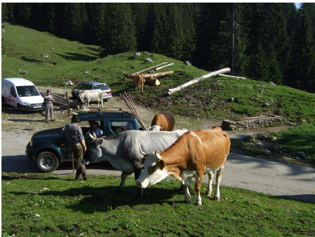
ドイツの南部の山岳地帯で地元特有の畜産種の保全に取り組む、助成を受けている農家。 写真の灰色の牛が助成対象なのだそうだ。

ヨーロッパの農業環境支払いの多くは 1980 年代から導入されているが、結果に基づく農業環境支払いも同じ頃からいくつかの地域で始まっている。特にドイツでの取組事例が多いが、「畜産における種の保存」などは多くの国で取り組まれている。他の農業環境支払いや農村振興政策全体の中で「結果に基づく農業環境支払い」がメニューの1つとして位置づけられている場合がほとんどである。