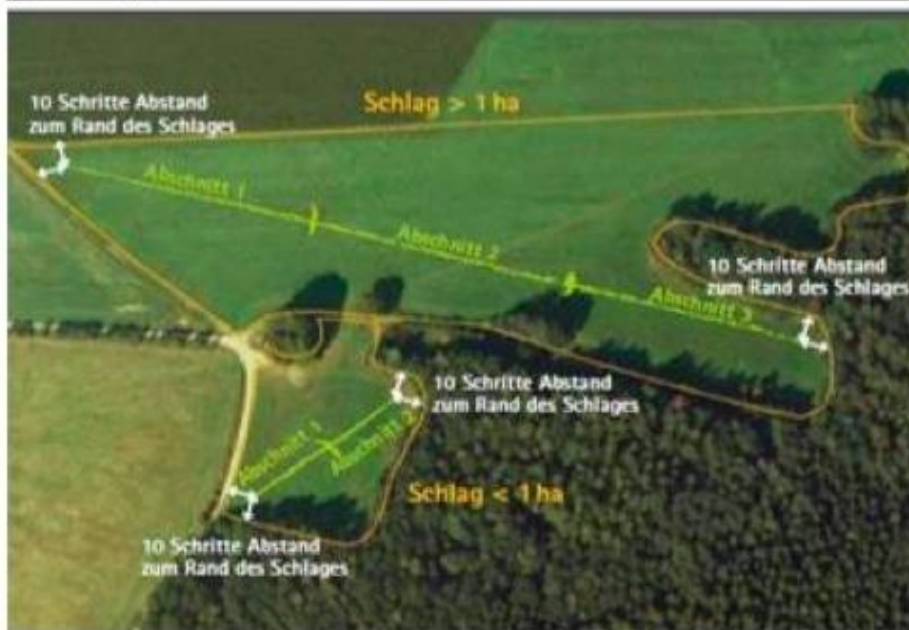
Sachsen, Germany (Freistaat Sachsen LULG, 2014)